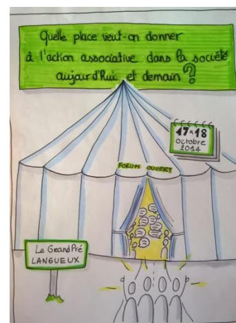
Dessin de Julie Boiveau facilitatrice graphique

La journée qui devait être commune n'a pas pu avoir lieu puisque le CDVA et le CG ne se sont pas entendus sur les objectifs et les modalités d'animation.